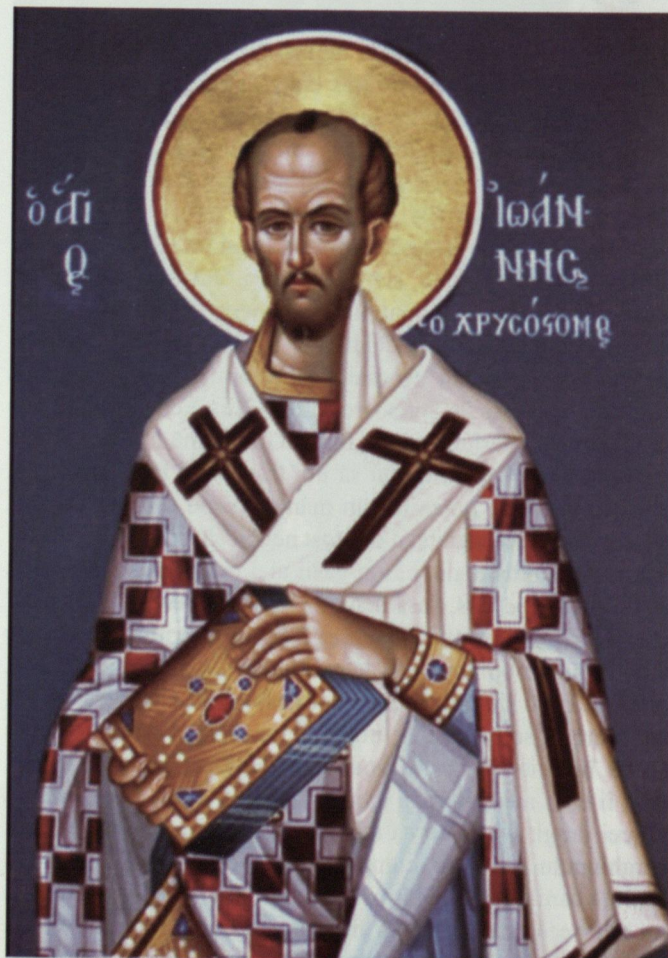
Sfântul Ierarh Ioan Gură de Aur, arhiepiscopul Constantinopolului http://www.doxologia.ro/sites/default/files/imagecache/imaginer-755x566/imaginer/2013/11/sfantul_ierarh_ioan_gura_de_aur_arhiepiscopul_constantinopolului_4.jpg