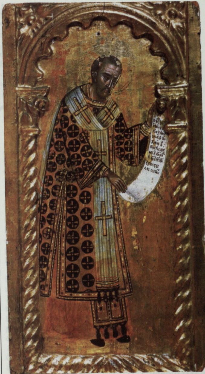
Sfântul Ioan Gură de Aur

La capătul zilelor istovitoare ale călătoriei, Ioan Gură de Aur de Austerlitz ajunge în cele din urmă la Cucuz, în Armenia, unde pustietatea și singurătatea pe care o resimte este apăsătoare: