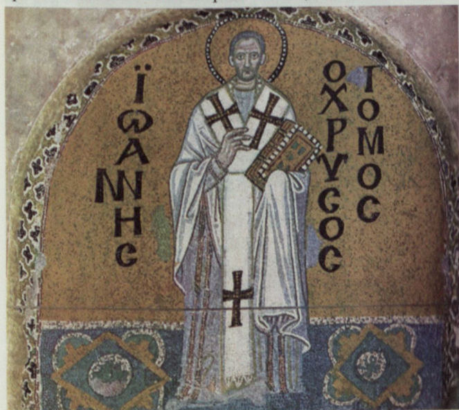
Marele ierarh Ioan Hrisostom – mozaic din naos, secolul al X-lea, Constantinopol, Sfânta Sophia.

Pot fi evidențiate mai multe caracteristici ale genului epistolar hrisostomian. În primul rând, toate scrisorile au