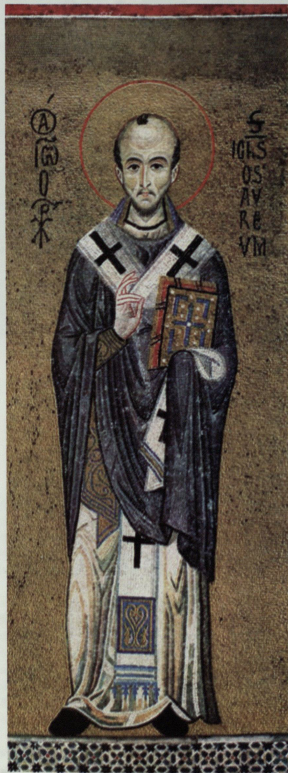
Sfântul Ioan Hrisostom – mozaic din secolul al XII-lea. Palermo, Capella Palatina Sursa: Les grands siècles de la peinture byzantine . Geneva: Albert Skira, 1953, p. 129. Lucrare aflată în Colecțiile Bibliotecii Academiei Române.

În cea de-a doua categorie a Scrisorilor hrisostomiene, adresate unor persoane oficiale (episcopului Inochentie I al