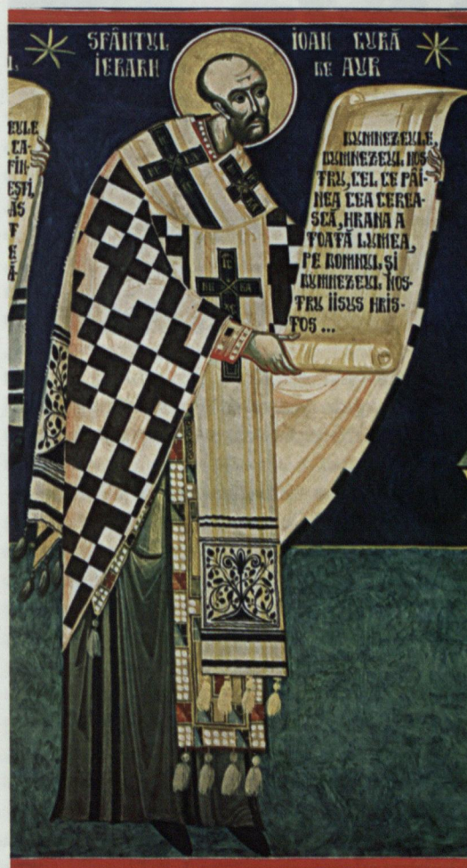
Sfântul Ierarh Ioan Gură de Aur.

Istoricul bisericesc Palladiu ne aduce mărturie că Ioan a păstorit Biserica Antiohiei mai bine de un deceniu, perioadă