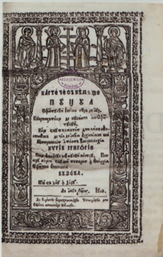
Ioan Hrisostom. Puțul. Cuprinzătoare de cuvinte ale Sfântului. Carte talmăcită din limba elinească de Arhiepiscopul și Mitropolitul a toată Ungrovlahia, Kyriu Grigorie. Buzeu, 1833.

Epistolele scrise în anii celui de-al doilea exil (404-407 d.Ch.) se bucură și astăzi de o aleasă considerație din partea cititorilor pasionați. În număr de 236, ele sunt păstrate în Patrologia Graeca și reprezintă o colecție de adevărate mărgăritare literare și duhovnicești. Legăturile neîntrerupte ale lui Ioan Hrisostom cu diferitele comunități creștine, dorința