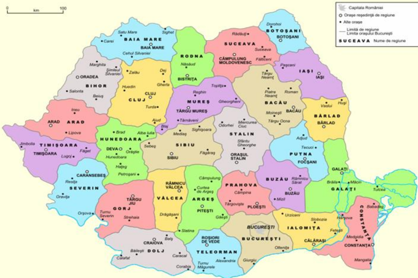
ORGANIZAREA ADMINISTRATIVĂ A ROMÂNIEI (1950-1952)